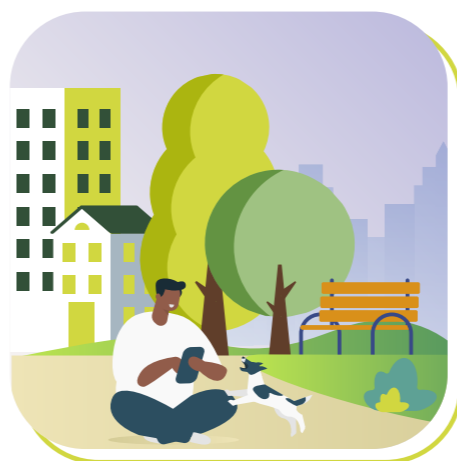
Parques urbanos e praças