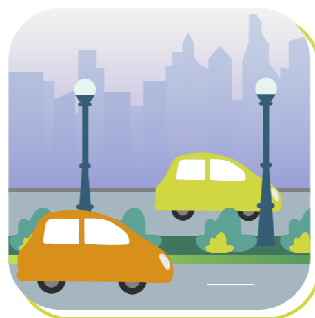
Canais de infiltração naturais (biowales)